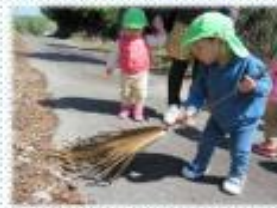
ほうきのような枝？ を見つけたそうすけくん...