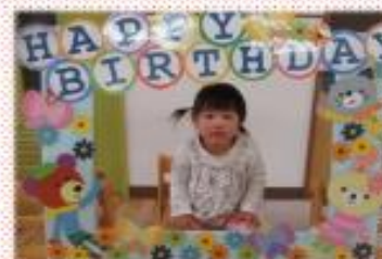
つづいゆいなちゃん。 2歳になりました。