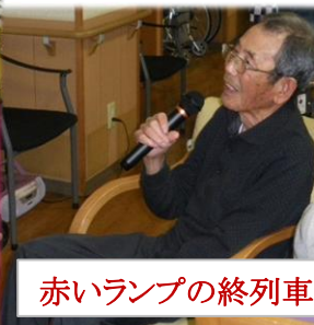
赤いランプの終列車