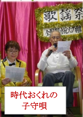
時代おくれの 子守唄